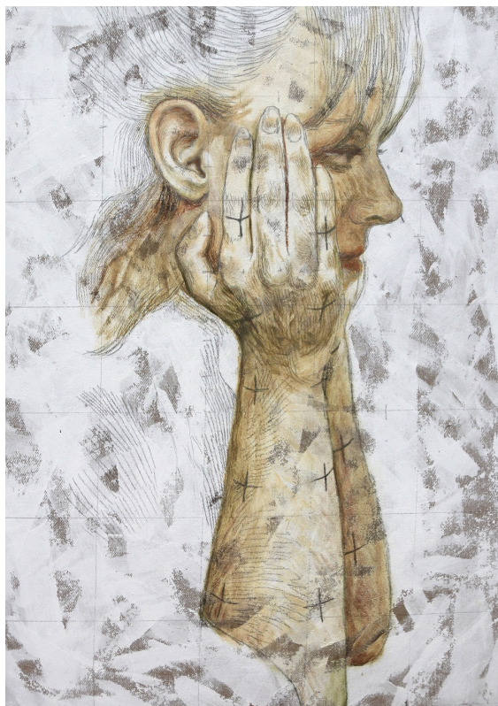
▲ « Portrait en attente 1 » Huile sur toile, 46x33 cm, 2023