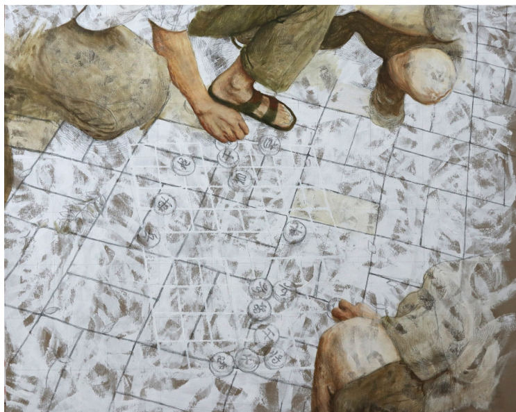
▲ « Échecs » Huile sur toile, 80x100 cm, 2023

Dans la rue, près de Yishu8, une scène m'a sauté aux yeux. Deux vieux messieurs, assis par terre, jouant aux échecs sur une grille qu'ils avaient tracé à la craie à même le sol. Et ce qui était encore plus beau c'est que cette grille était en décalage avec la grille que formaient les pavés. A ce moment-là, je lisais Borgès. Et il y a ce texte sur les jeux d'échecs, où le joueur est autant déplacé qu'il déplace les pions. Il y a là un parallèle qui me plaît beaucoup.